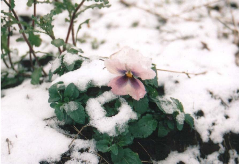
"I think it's time we went gay bashing agian!" Grosvenor Street, Manchester.