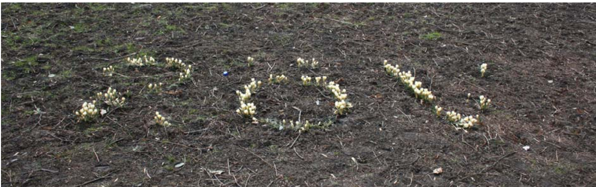
Textat med krokus.