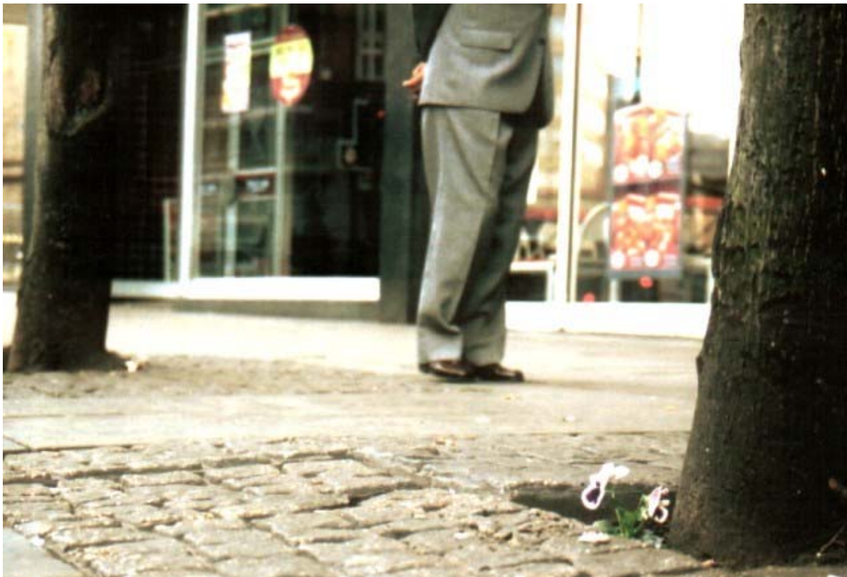
"Faggot!" Oxford Road Manchester.