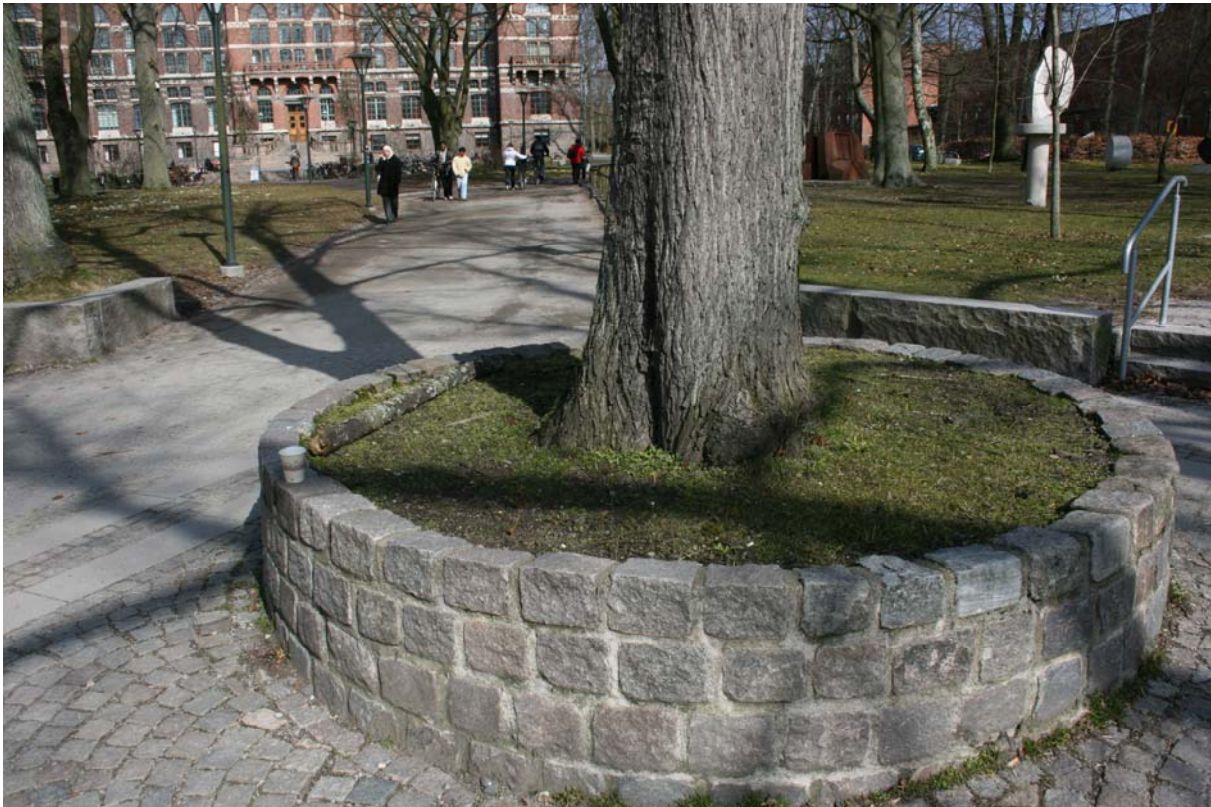
Krokus har planterats utanför universitetsbibliteket i Lund.

Men varför gör hon detta? Hon tror att det ligger lite i hennes natur att aktivera sig i saker som är bra. Det här är bra för att folk blir glada över att se blommor menar hon. Det är kul att kunna göra andra glada men också för att för kunna få gå ut och gräva för hon har ingen egen trädgård. Hon har pysslat lite med gatukonst då hon gjort pärlplattor som hon sen klistrat hon upp på offentliga platser. Det gjorde hon med samma syfte – att göra folk glada. När hon planterar så har hon oftast ingen koll på vem marken tillhör Men hon skulle inte gå in i en trädgård och plantera, det tycker hon är att gå över gränsen. Ägarförhållandet skulle inte hindra henne så länge hon tycker det ser ut som försummad mark. Ställen hon väljer att plantera på väljer hon utefter det ser lyckat ut, men hon skulle inte vilja förstöra en design. Hon skulle t ex inte vilja plantera något mitt på tallriken i pildammsparken. Gerillaodling är för henne en hållbar rabatt i likhet med var Reynolds anser. Att tillexempel sätta flera granar i en rondell som hände i Göteborg nyligen (Okänd person 2009) är mer en politisk aktion eller ”statement”.