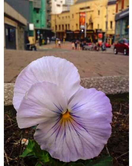
"You Fucking Queer Cunt!", " Withworth Street, Manchester, Picture rights P. Harfleet.