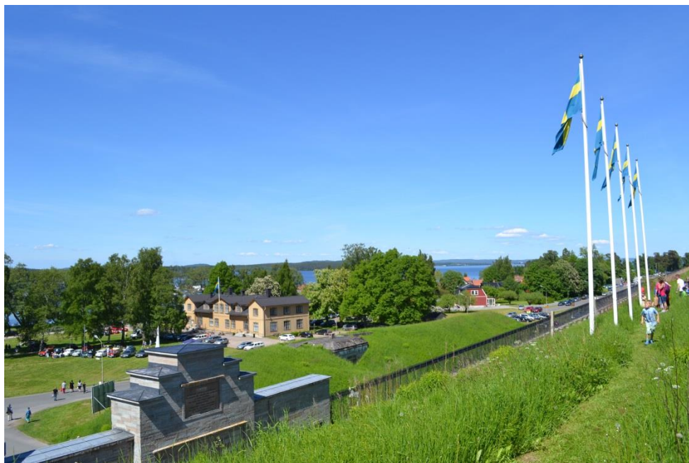
Bild 4: Utsikt från en vall på fästningen med Vättern i bakgrunden.

Försvarmakten äger vissa delar av marken inom tätorten Karlsborg. Detta påverkar de planer som kommunen kan göra då de vill forma och utveckla orten. Även om kommunen inte försökt att göra en vindkraftsplan så har de gjort ett försök att få loss mark för att bygga en ny F-9 skola. Kommunen ville att skolan skulle placeras nära sporthallen så att den kunde användas mer regelbundet och minska avståndet för eleverna vilket därigenom skulle ökat säkerheten för dem. Planerna stoppades dock av försvarmakten som inte vill tillåta att någon mark i det området används till annat än deras militära verksamhet.