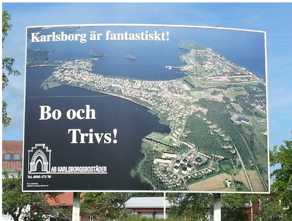
Bild 1: Skylt i Karlsborg. Samhället Karlsborg ligger till vänster och fästningen ligger på udden i den högra övre delen.

Göta Kanal och den har idag stor betydelse för Karlsborgs besöksnäring. Vid samma tid växte rädslan för krig mot Ryssland. Stockholm låg oskyddat och von Platen påvisade då nyttan med centraförsvaret. År 1809 togs beslut om att bygga en fästning inne i landet och Karlsborg valdes ut som plats. Karlsborgs fästning är idag Sveriges största militära minnesmärke. I händelse av krig skulle den skydda Sveriges guldreserv och kyrkan inne på fästningen skulle fungera som plenisal så att riskdagen kunde sammanträda (Pettersson 1964). Kommunens slogan ”Sveriges reservhuvudstad” lever fortfarande kvar och används med stolthet.