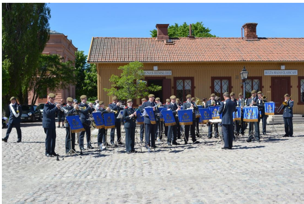
Bild 3: Hemvärnets musikkår spelar på fästningstorget.

Frågan är om det är enbart är kommunen som vill ha ett levande fästningstorg eller om försvarsmakten delar planerna.