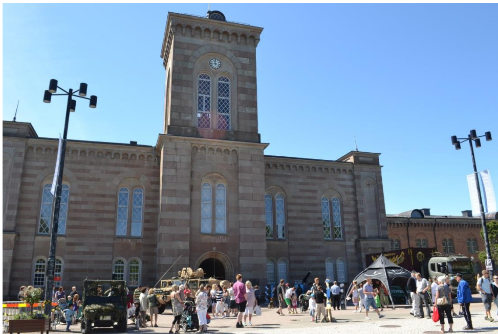
Bild 5: Försvarsmakten visar upp delar av sin verksamhet utanför Garnisonskyrkan på fästningen. Militärens representation under nationaldagsfirande 2013.

gemensamt intresse av att förutsättningarna för Försvarsmaktens utveckling i regionen är fortsatt goda (forsvarskonferensen.se).