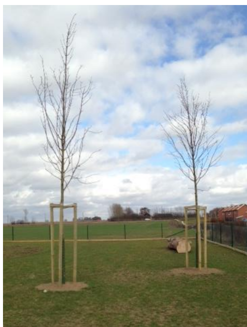
Figur 10.

I figur 8 kan vi se exempel på där en hårdgjord yta har anlagts i anslutning till ingången av rastgården. Både figur 8 och 9 visar hur staketet möter gräset genom en kant som gör det svårare för hundarna att kunna gräva sig ut. Staketets karaktär möjliggör för hundarna att se vad som pågår utanför rastgården och ger också intrycket av att rastgården är ännu större än den är.