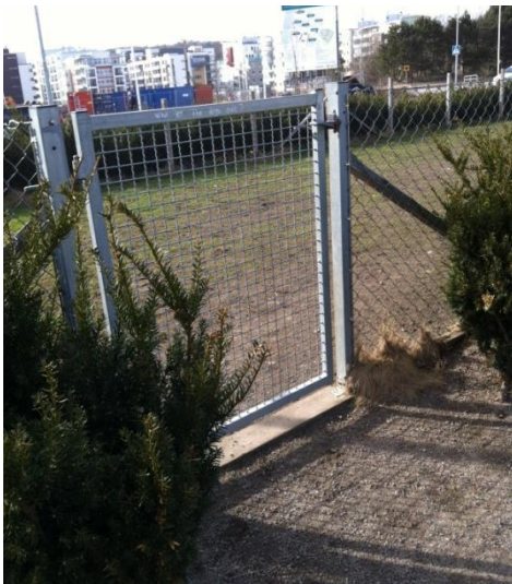
Figur 6.

Figur 5 visar att markmaterialet har slitits mycket, vilket förmodligen beror på hundrastgårdens mindre storlek. Hela rastgården är omgiven av idegransplantor, men det finns inte tillstymmelse till växtlighet innanför inhägnaden.