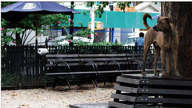
Figur 1. Hund i stadspark.