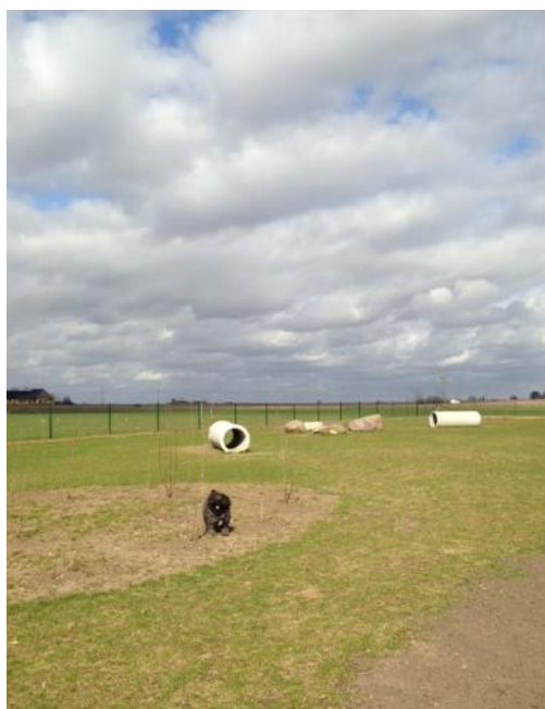
Figur 11.

Träd har visat sig vara önskvärda i hundrastgårdar. I figur 10 visas exempel på relativt nyplanterade träd. Även möjlighet till lek genom betongrör och trädstockar kan ses i figur 10 och 11. I bilderna framkommer det också att storleken på den här rastgården inte är något att klaga på.