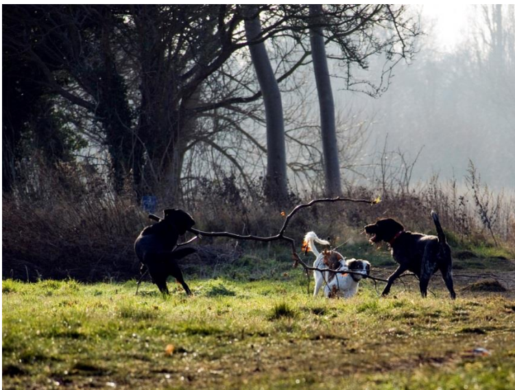
Figur 16. Pinnar och andra lösa föremål kan trigga habegär och aggression hos hundar.

Många hundägare för fram tankar om att vatten bör vara tillgängligt, speciellt under de varmare delarna av året. Detta går självklart ur kostnadssynpunkter inte att tillhandahålla på alla hundrastgårdar i en kommun, men kanske de mest populära. En hållare med hundbajspåsar verkar också vara en sak som hade kunnat bidra till att skapa trivsel i hundrastgårdarna. Om det finns hundpåsar tillhanda på platsen tror nämligen många att det hade minskat förekomsten av hundlämningar i rastgården. En del hundägare uttrycker önskemål om lösa föremål i hundrastgårdar, exempelvis pinnar att utföra apporteringsövningar med. Även om detta kan tyckas vara ett trevligt inslag bör de, enligt hundpsykologer, undvikas. Lösa föremål, såsom pinnar och leksaker kan nämligen trigga habegär och därmed konfrontation hos hundarna, vilket skapar en obalanserad situation.