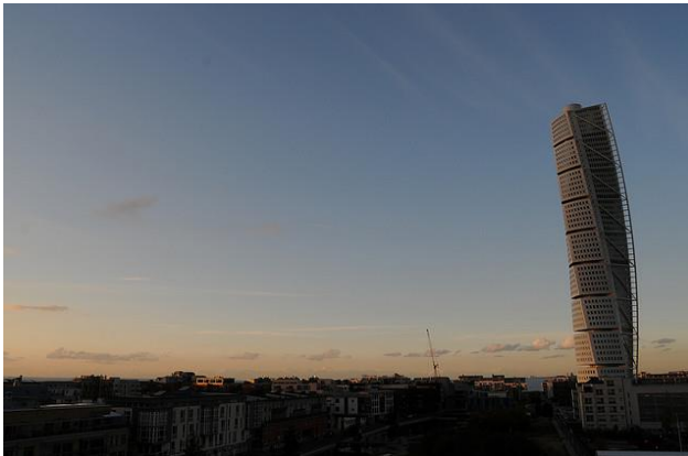
Figur 4. Turning Torso III

I Malmö bor 11432 hundägare med 13725 hundar (Jordbruksverket, 2013). Med en stor hundpopulation har Malmö stad utvecklat ett hundprogram som har tagit aspekten hundrastning i staden till en ny nivå. De har insett att platserna för hundrastning inte bara bör vara en tråkig yta att släppa hundarna lösa på, utan att de faktiskt också kan fungera som viktiga mötesplatser för hundar och deras ägare i våra städer. I Malmö finns totalt 42 hundrastgårdar, samt 8 hundrastplatser. Skillnaden mellan hundrastgård och hundrastplats är att hundrastgårdar är mindre, inhägnade områden som oftast är