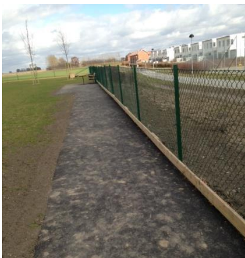
Figur 8.