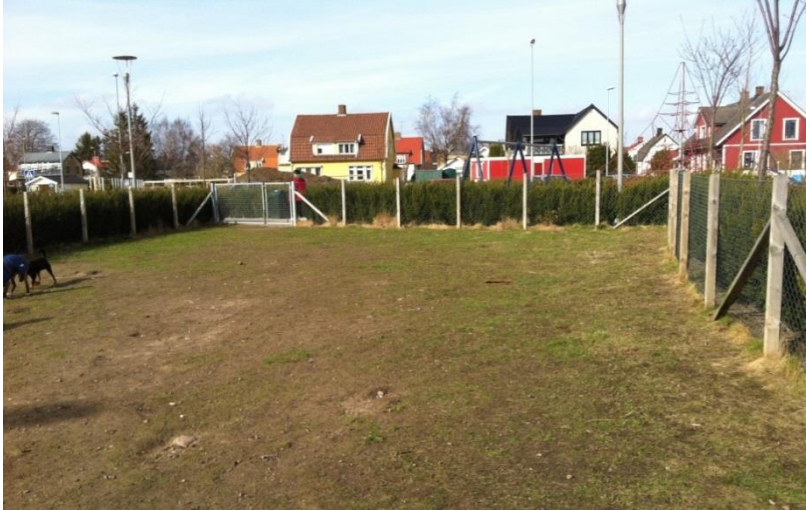
Figur 5.

Här studeras utformningen av hundrastgårdar, där hundägares önskemål utifrån intervjustudier, aspekter från litteraturstudien och kriterier från Halmstad och Malmö har fungerat som underlag. Två olika hundrastgårdar har valts ut för att visa exempel på hur dessa kan se ut.