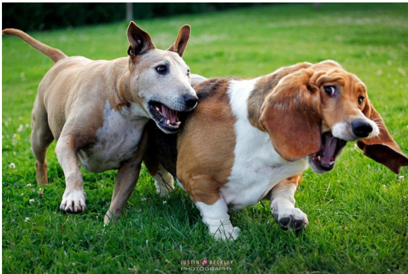
Figur 15. Överraskningsmoment kan ge negativa konsekvenser.

Träd och buskar skapar skugga under soliga varma dagar, vilket borde vara ett absolut måste i en hundrastgård. Vegetation bidrar också till att skapa en trevligare miljö i rastgården, både för hundar och hundägare. Det finns dock ett problem med att plantera in väldigt täta buskage, speciellt om det är tänkt att flera hundar ska vistas på området samtidigt. Hundar gillar, som hundägare antytt, att nosa i och kring buskarna, vilket de självklart ska få möjlighet att göra. Jag skulle personligen hellre rekommendera användandet av glesare buskar, så hundarna har möjlighet att hela tiden hålla koll på var de hundarna på området befinner sig. Att som hund i godan ro gå och nosa vid en buske och att det plötsligt hoppar fram en annan hund från ingenstans är ett exempel på ett negativt överraskningsmoment som kan trigga aggression. Glesare buskar skulle skapa bättre sikt för hundarna i marknivå och därmed minska risken för att detta sker.