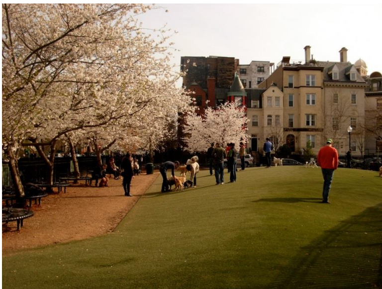
Figur 12.