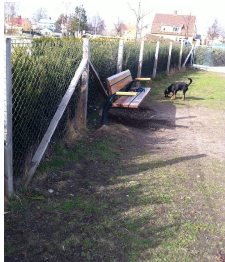
Figur 7.

Figur 6 visar ingången till hundrastgården. Ett problem som kan förekomma med enkelgrindar är att om någon inte är uppmärksam när grinden öppnas kan en hund lätt smita ut. En dubbelgrind hade möjligen varit att föredra. Bänken i figur 7 är ett uppskattat inslag och en plats för hundägare att sitta ned och betrakta sin hunds aktiviteter i rastgården.