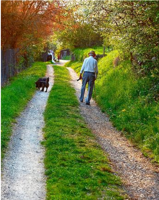
Figur 2. För äldre människor kan vänskapen med sin hund vara något alldeles extra.

kan hundägandet vara väsentligt för att detta ska ske. För framför allt äldre människor kan det vara svårt att i vardagen hitta sätt att stifta nya bekantskaper på. Chanserna till detta ökar dock om personen i fråga är hundägare (Miller & Howell, 2008).