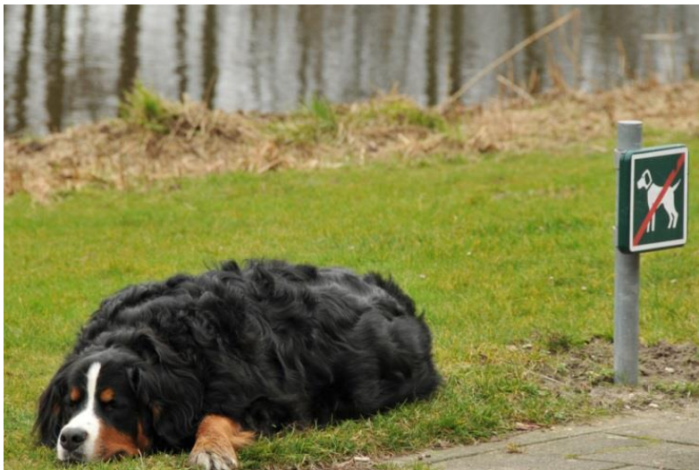
Figur 14. Är hundförbud verkligen rätt metod att ta till?

Det finns ett problem med att separera hundägare från resten av användarna av den offentliga miljön. Separationen kan nämligen bidra till en större icke-acceptans av hundarna och få lite samma effekt som segregation mellan folkgrupper i en stad. Hundägarna blir till en egen "grupp" som inte får tillgång till stadens offentliga rum så mycket som andra människor. Samtidigt måste problemet med hundrädsla självklart respekteras. Det är lätt för oss hundägare att kräva tillgång till de offentliga miljöerna utan restriktioner, men jag tror att en viss restriktion är nödvändig för att hundrädda personer ska kunna känna sig trygga. Speciellt eftersom hundägare ofta inte tar det ansvar de har på fullt allvar. Att ha separata hundrastgårdar är ett uppskattat inslag i den urbana strukturen, men det får inte bli så att dessa ökar separationen från resten av stadens invånare ytterligare.