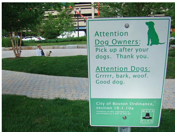
Figur 17. Tydlighet gällande upplockningstväng.