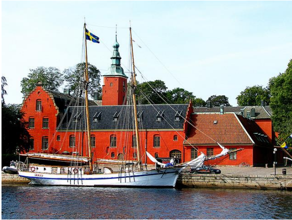
Figur 3.