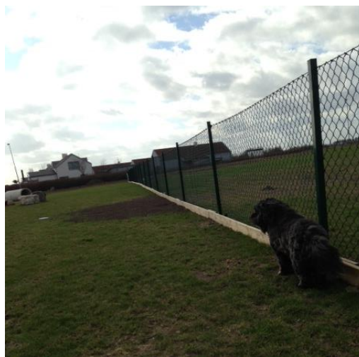
Figur 9.

I figur 8 kan vi se exempel på där en hårdgjord yta har anlagts i anslutning till ingången av rastgården. Både figur 8 och 9 visar hur staketet möter gräset genom en kant som gör det svårare för hundarna att kunna gräva sig ut. Staketets karaktär möjliggör för hundarna att se vad som pågår utanför rastgården och ger också intrycket av att rastgården är ännu större än den är.