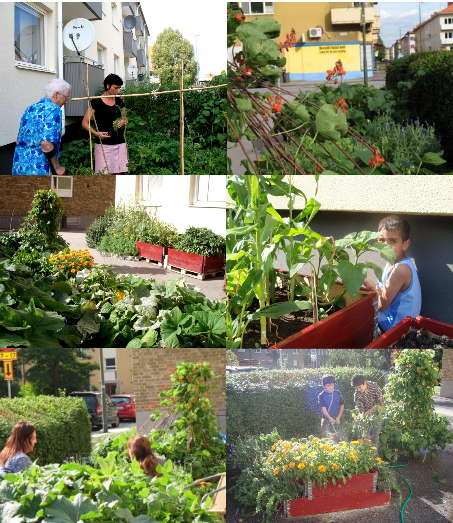
Figur 15. Kollage med fotografier från Barn i Stans odlingar.