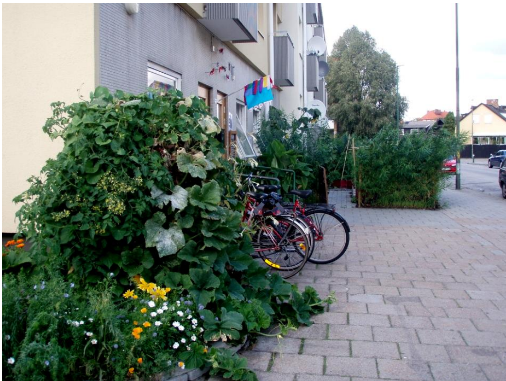
Figur 6. Samma plats efter att kolonilotten och andra odlingar anlagts vid Barn i Stans lokal.