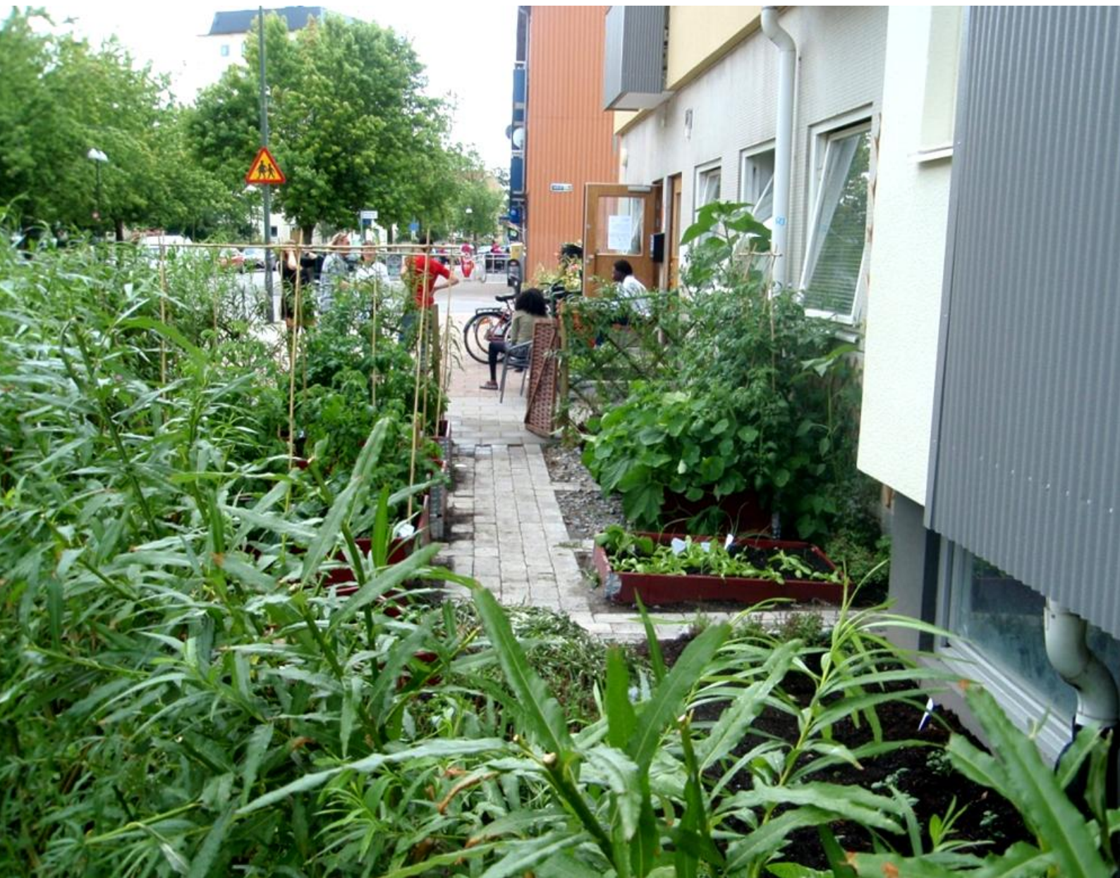
Figur 14. Fotografi av kolonilotten. I bakgrunden syns flera personer som står och sitter utanför Barn i Stans verksamhetslokal.