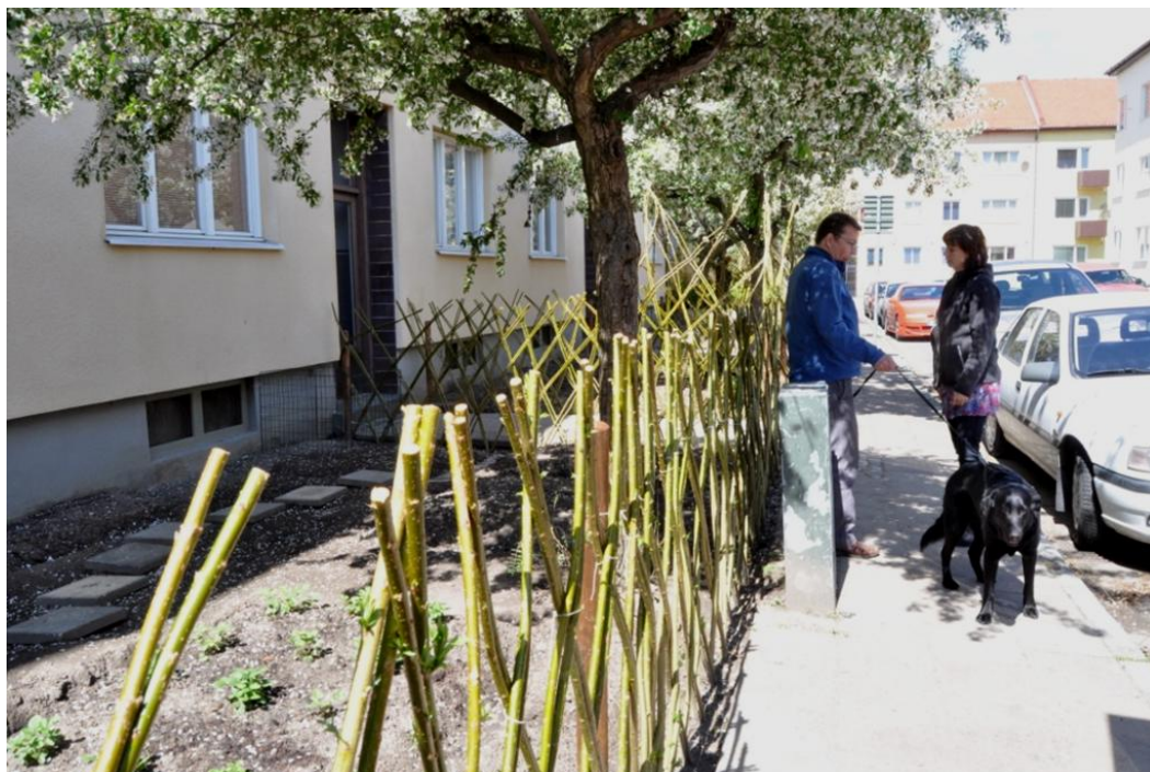
Figur 11. På bilden syns förtomten till ett bostadshus i Seved som gjorts i ordning för att börja odla på. Fastighetsägaren och de boende har inspirerats av Barn i Stans odlingar och blivit en del i det odlingsnätverk som startats. Tidigare växte höga och täta buskar på förtomten.

Som tidigare nämnts har projektet Barn i Stan en begränsad tid med ekonomiskt stöd från Allmänna Arvsfonden. När uppsatsen skrivs är det ingen som vet hur framtiden för Barn i Stan ser ut. Men att odlingsnätverket startats och många visat intresse kan tolkas som att odlandet i Seved kan bli mer förankrat än endast beroende av Barn i Stans verksamhet.