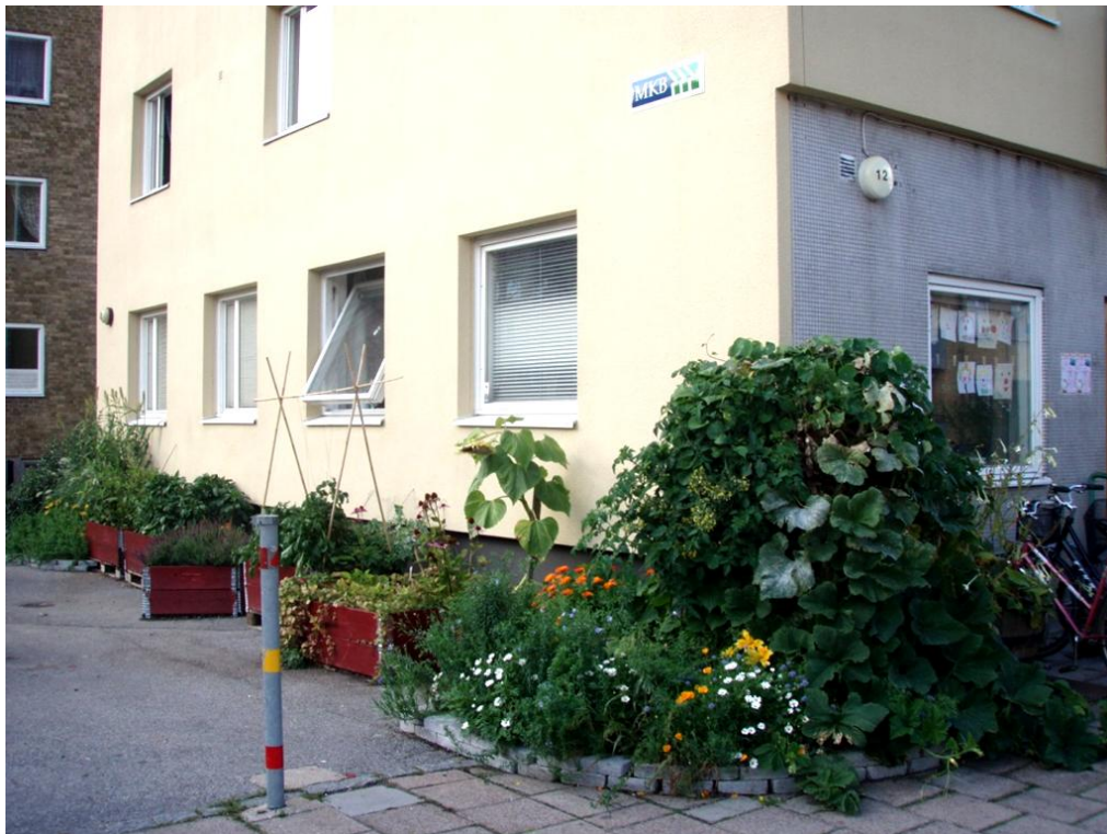
Figur 8. Förutom kolonilotten anlade man också några rabatter och odlade i pallkragar som placerades direkt på asfalten. På bilden syns hur hörnet av byggnaden såg ut efter en odlingsäsong.