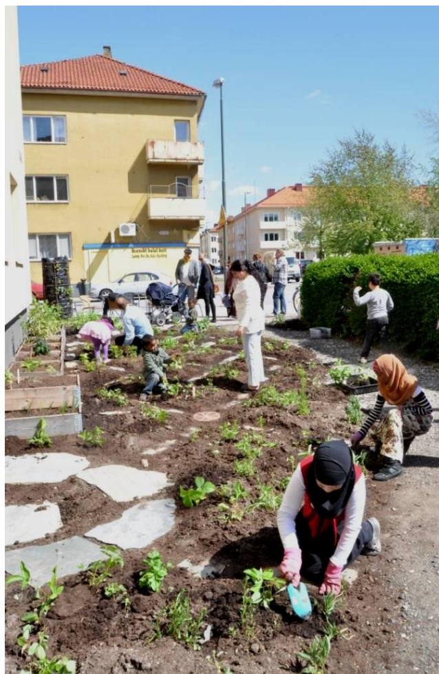
Figur 13. Inför andra säsongen av odlingsprojektet fick Barn i Stan hjälp av fastighetsägaren att bryta upp asfalten på den plats man tidigare odlat på i pallkragar. Den har gjorts till en liten trädgård med en slängad grusgång och odlingsbäddar.