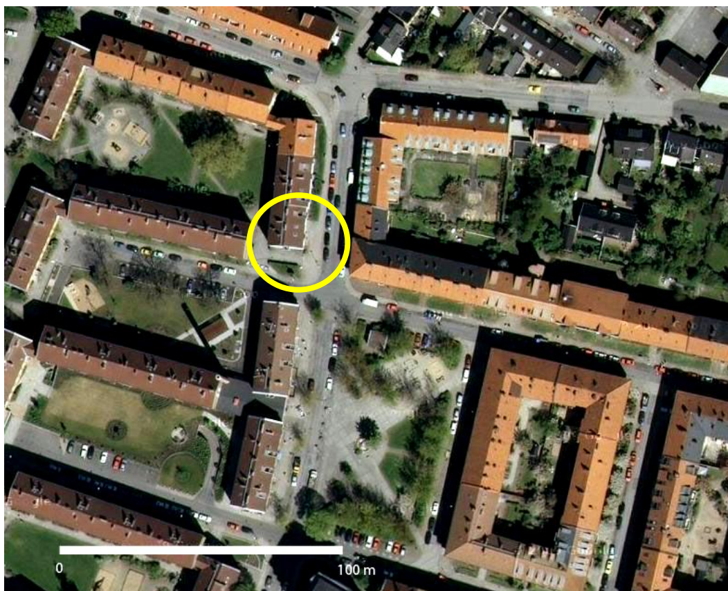
Figur 2. Seved uppfifrån. Cirkeln i mitten av bilden markerar platsen för Barn i Stans verksamhetslokal och odlingar. Snett nedanför cirkeln syns också Sevedsplan, torget i Seved.

Personerna som arbetar med Barn i Stan är av olika nationalitet. Under vardagseftermiddagar anordnas aktiviteter i linje med olika teman som deltagande barn arbetat fram. Bakning och matlagning, teater, sång och musik samt textilarbete är exempel på aktiviteter. Varje onsdagsförmiddag spelar ett gäng seniordamer bingo i lokalen. De har också ett café med bakverk som de bakat själva och arrangerar olika typer av tillställningar och händelser som lockar boende i Seved (Barn i Stan, 2010).