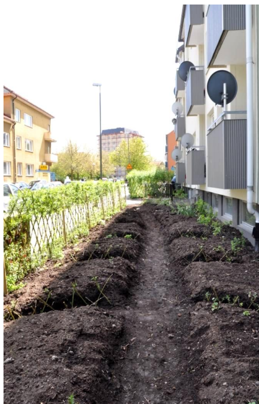
Figur 9 och 10. Inför odlingsprojektets andra år fick Barn i Stan tillstånd av fastighetsägaren att utvidga sina odlingar. Bilderna visar boende och personal som flätar pilstaket samt odlingsbäddar som gjorts i ordning.