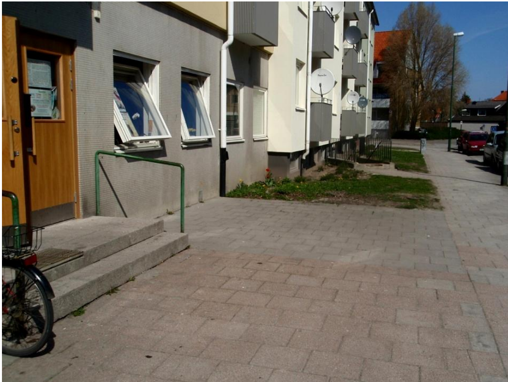
Figur 5. Platsen utanför Barn i Stans verksamhetslokal innan kolonilotten anlades.