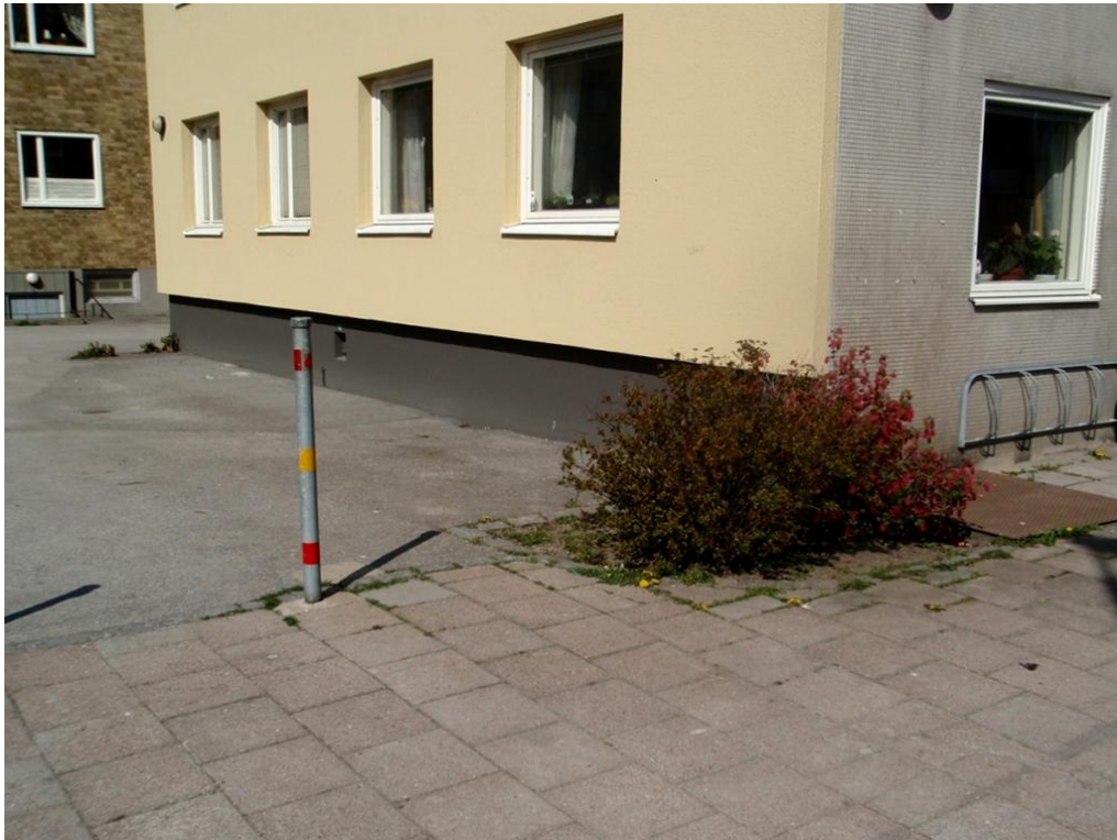
Figur 7. Hörnet på huset där Barn i Stans verksamhetslokal finns. Bilden är tagen före man började odla.