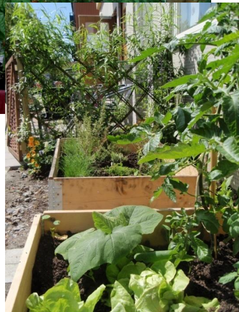
Figur 3 och 4. Fotografier från den kolonilott som anlagts utanför Barn i Stans verksamhetslokal i Seved.