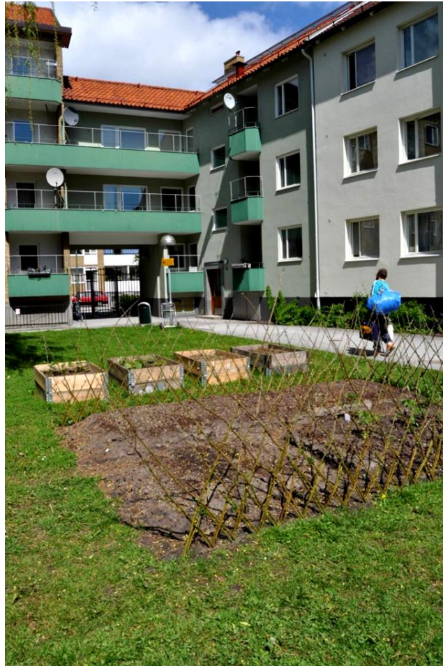
Figur 12. Bilden visar en innergård i Seved där boende börjat förbereda ytor att odla på.